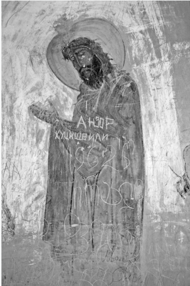
דוויט גארז'י אודבנו, כנסייה ראשית, ציור קיר, המאות ה-11 וה-13, יוחנן המטביל