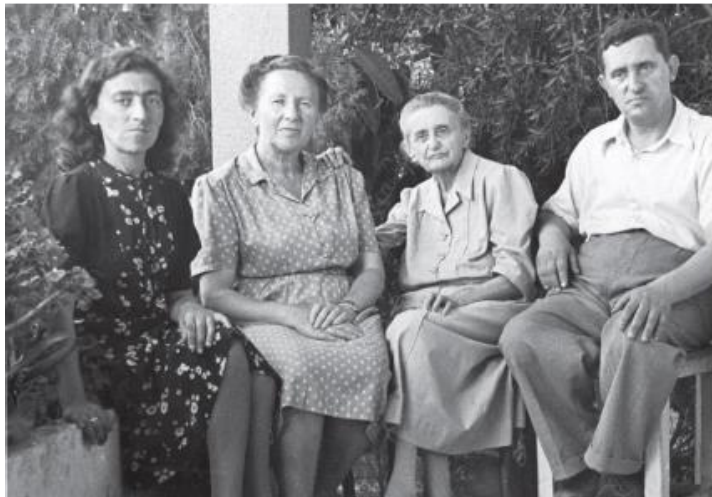
ראַקאָווסקי איז 80 יאָר אַלט