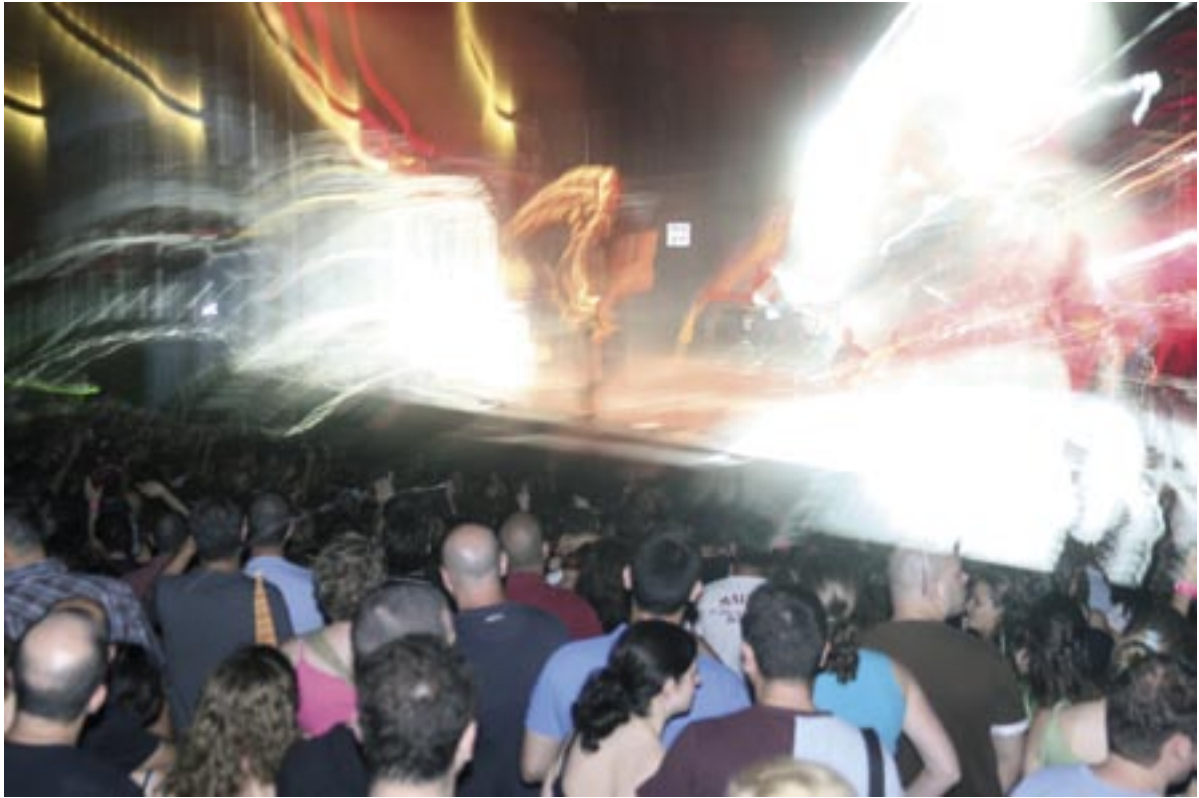
קהל החוגגים מול הבמה המרכזית ביום הסטודנט.