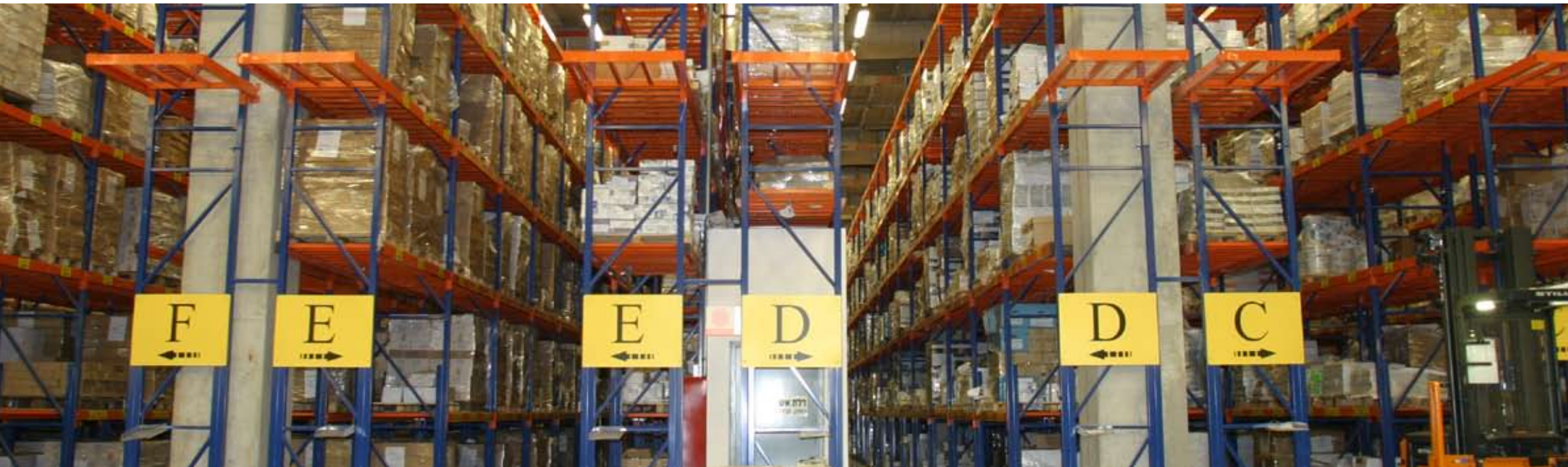
חומרי לימוד מודפסים וכן חומרים מוקלטים ועזרי לימוד שונים נשלחים מקריית האוניברסיטה ברעננה לבתי הסטודנטים באמצעות הדואר. בשנת הלימודים תשס"ט נשלחו 153,997 ערכות לימוד ו-774,045 מכתבים.

שירותים חדשים: הספרייה מציעה מהשנה שירות של הזמנת סריקה של מאמר מכתב עת או של עמודים מתוך ספר וקבלתו ישירות לדוא"ל של המזמין. שירות חדש אחר הוא משלוח SMS ובו תזכורת על מועד החזרת ספרים.