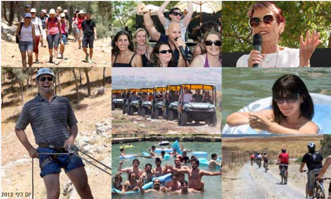
יום כיף 2012

קורסים לניהול, קבוצות עמיתים, השתלמויות ומפגשי שימור והעשרה. בד בבד התקיימו השתלמויות וימי פעילות במחלקות השונות, שמטרתם לשפר וליעל את הממשקים ואת תהליכי העבודה במחלקות.