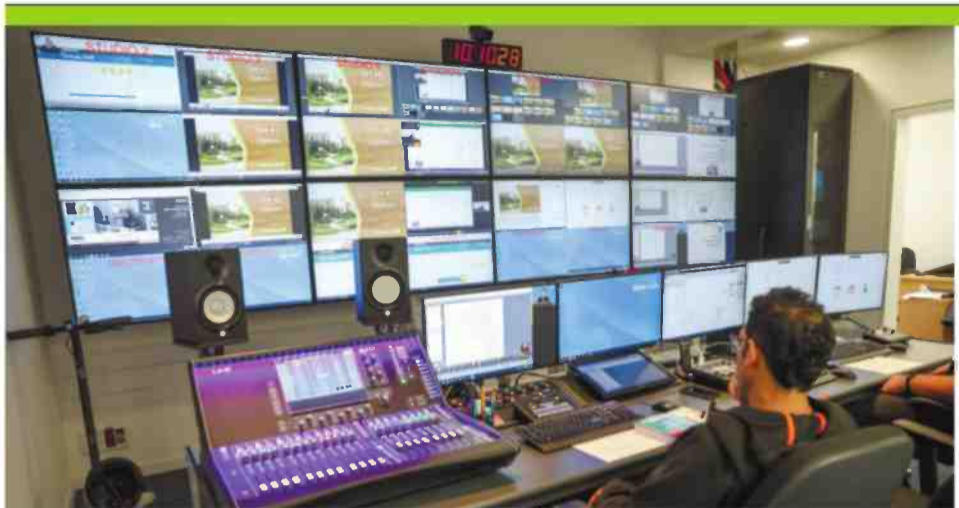
חדר בקרה ללימוד מרחוק באוניברסיטה הפתוחה