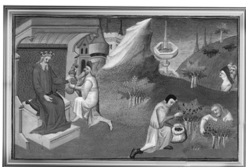
החברה ההיסטורית הישראלית

התצפית ויכולת הפעולה של אנשים מכל שכבות החברה – נשים וגברים, משכילים ועובדים – שהם הגיבורים המרכזיים בכל עבודותיה.