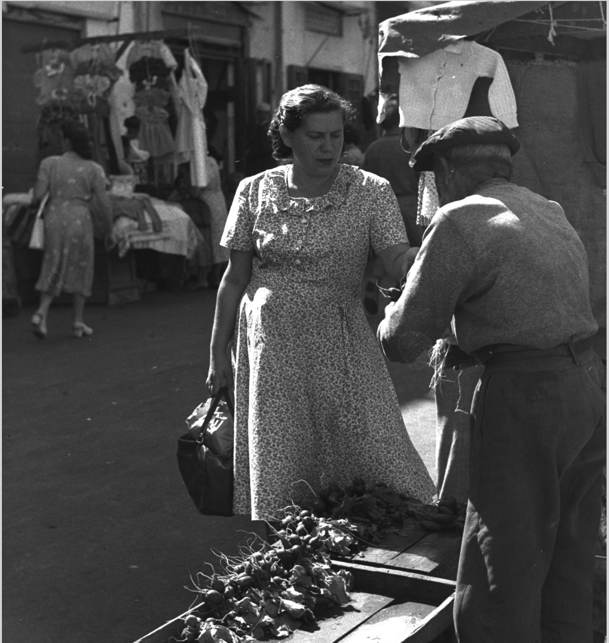
מוכר צנוניות, שוק הכרמל, 1949