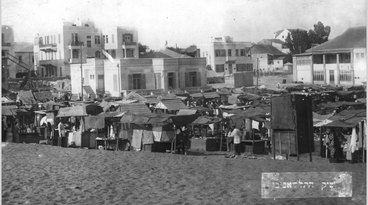
השוק בפינת הרחובות הכרמל ואלנבי, 1923-1925