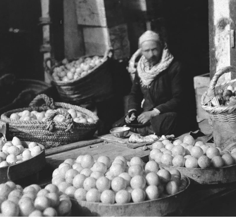
סוחר תפוזים, יפו, 1923