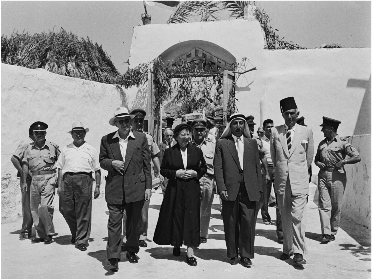
ביקור נשיא המדינה יצחק בן-צבי ורעייתו רחל ינאית ביישוב בקה אל-גרבייה, בלוויית חבר הכנסת פארס חמדאן, ספטמבר 1956

למשל, מדובר היה במוצע הגבוה מ-80 אחוזי תמיכה. הדבר נבע גם מפעילות מסיבית של מפא"י לעידוד הצבעה בעבורה או בעבור הרשימות הערביות שפעלו בהשראתה. בראש ובראשונה, מדובר היה בפעולות שכנוע שערכו בכירים במפא"י ובמפלגת העבודה בקרב האזרחים הערבים. לפני כל מערכת בחירות דאגו מפא"י ומפלגת העבודה להציג את הקשר שבין חברי רשימות הלוויין לדמויות מרכזיות בחיי המדינה: ראש הממשלה, שר החוץ, שר המשטרה, שר האוצר ועוד. האחרונים הפגינו נוכחות באספות בחירות של רשימות הלוויין וקראו לאזרחים הערבים להצביע בעבורן. מפא"י, ומאוחר יותר גם מפלגת העבודה, ניצלו את שליטתן במוסדות המרכזיים של המדינה כמו ההסתדרות, קופת חולים, משרדי הממשלה, הממשל הצבאי וכיוצא בזה כדי להשפיע על הצבעת הערבים בקלפי. באי הכוח של המפלגות לא נמנעו גם מהפעלת לחצים על האזרחים הערבים ואף מהשמעת איומים תוך קריאה להצביע לרשימות הערביות. הם עשו זאת, למשל, תוך ניצול יכולתם לשלוט בחלוקת