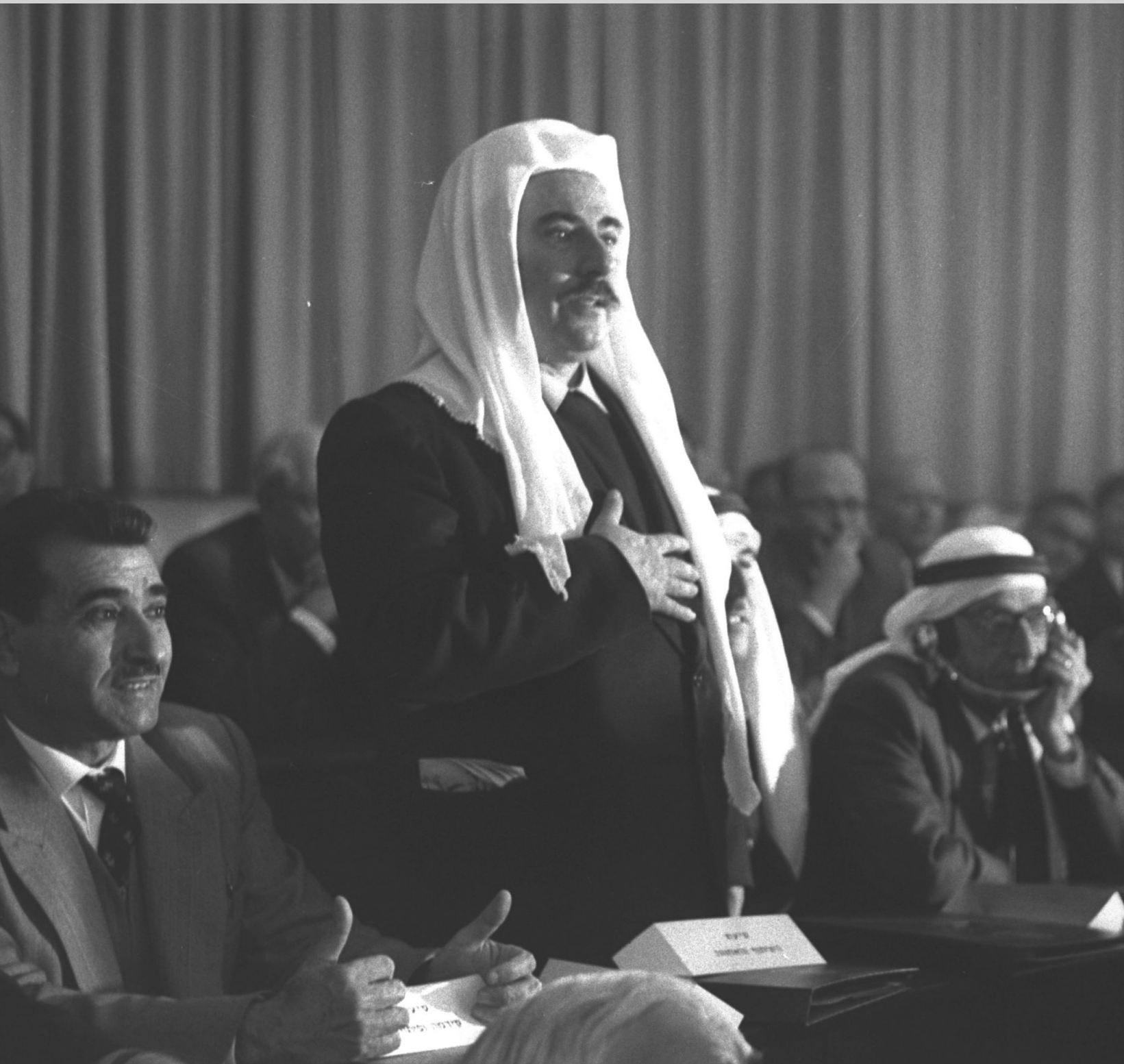
חבר הכנסת לביב חוסיין אבו רוכן מעוספיא נשבע אמונים למדינת ישראל במושב פתיחת הכנסת הרביעית בירושלים. מימינו: חבר הכנסת מחמוד נאשף, נובמבר 1959