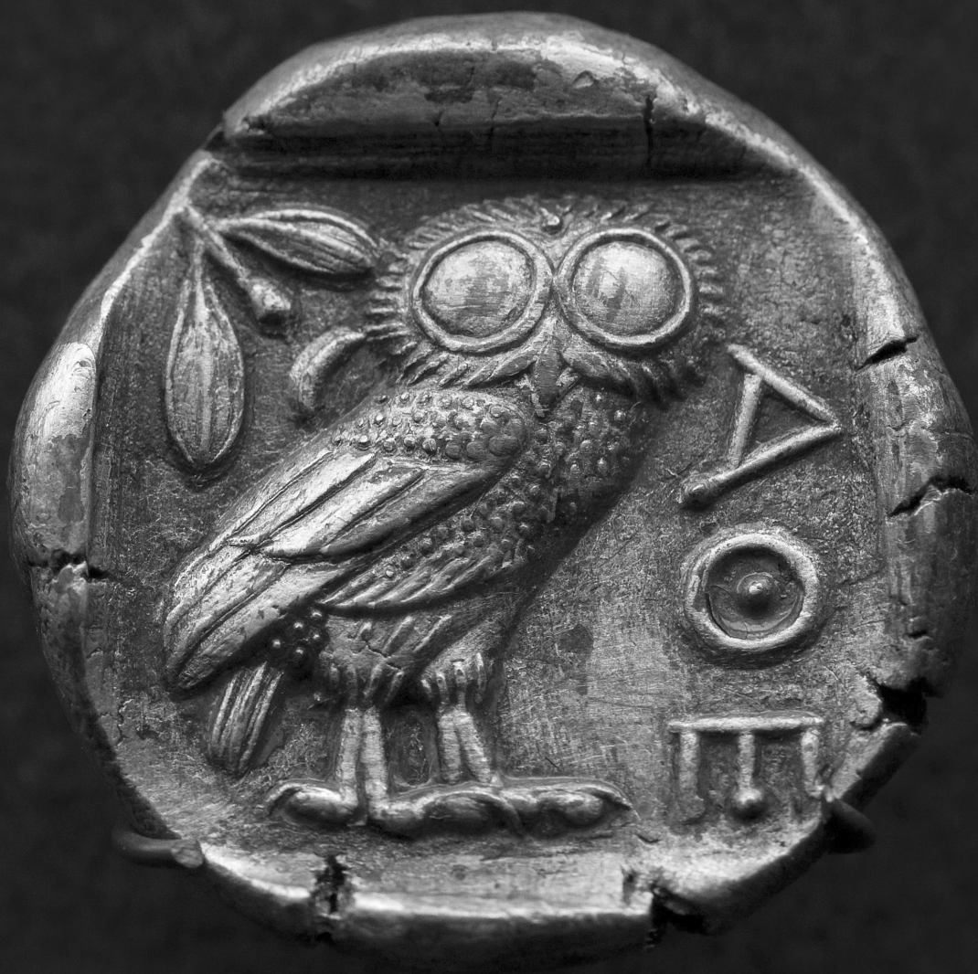
ה"נשוף של אתונה" על מטבע אתונאי שערכו ארבע דרכמות, המאה החמישית לפני הספירה