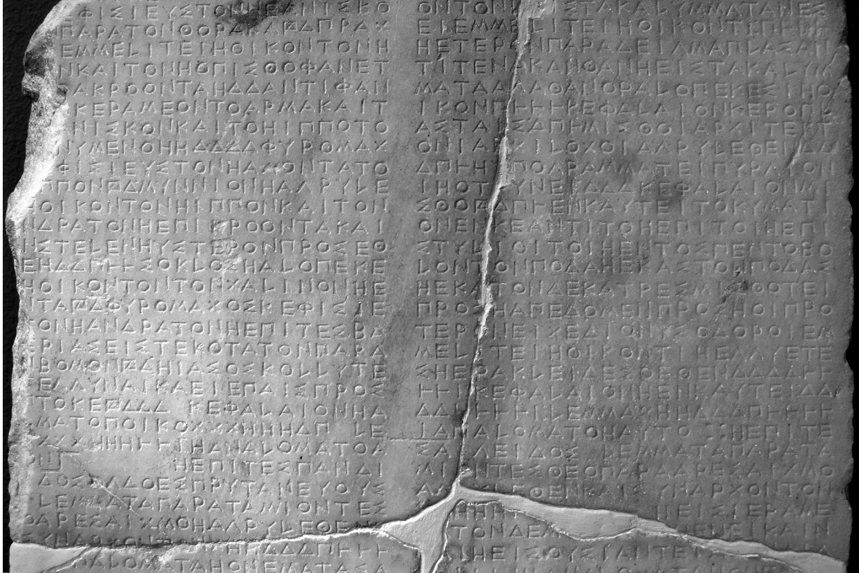
פרט מתוך אחת הכתובות המונות את ההוצאות על בניית מקדש הארכתיון (Erechtheion) באתונה. בדו"ח מפורטות כל פעולות הבנייה וזכרים בשם הפועלים שקיבלו תשלום.

עניים, אלא שעושרם לא הספיק כדי לגרוף הון פוליטי לרוב: אנשים כמו קליאון (Cleon), שאביו עסק בעיבוד עורות, או דמוסתנס (Demosthenes), שאביו היה בעל מפעלים לייצור נשק. ניקיאס (Nicias), המצביא במסע הנורא לסיציליה שהביא למפנה הגדול במלחמת הפלופונס, היה דמות ביניים: עשיר מופלג ואריסטוקרט בהתנהגותו, אך הוא שאב את עושרו ממכרות הכסף של לאוריון ומעבדים שהשכיר לקבלני המכרות. לא לשווא היה יכול גורגיאס (Gorgias) הסופיסט לטעון, לקראת סוף המאה הרביעית, כי מי שבקיא ברטוריקה ויכול לשכנע אחרים הוא למעשה אדון כל הבריאה. ההון הלך אחר השלטון, והשלטון בדמוקרטיה אחר הרטוריקה. במאה הרביעית לפנה"ס המשפחות המיוחסות כבר אינן גורם משמעותי בפוליטיקה האתונאית – מהרגע שהעם היה יכול לנהל את כספיו, הוא הפך להיות העשירי שבעשירים, ושום עשיר לא היה יכול להתחרות בו.