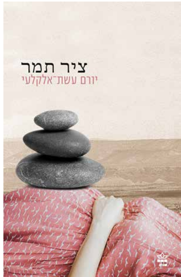
איור: תיאור, לית

ניסיתי לבטא בספר את אמונתי העמוקה שעד שלא נדע להכיר בצער ובכאב של הצד השני, לא נדע להכיר באמת ובתמים בצער ובכאב שלנו עצמנו, ונמשיך להתקיים בתחושה חריפה של צדק קורבני ובלתי מתפשר. נתתי ביטוי לתפיסה זו בסיום ציר תמר : "תמר וסועד זוחלות בחול, מוחקות את עקבותיו של יוסף, ובכך הן מצילות את חייו". סצנה דומה מופיעה גם בספרי האוטוביוגרפי אדם הולך הביתה שבה אני מתאר כיצד, בגלל תחושת הזדהות רגשית עמוקה עם חייל מצרי הנמלט לביתו משדה הקרב, איני מסוגל לירות בו ולהרגו. ■