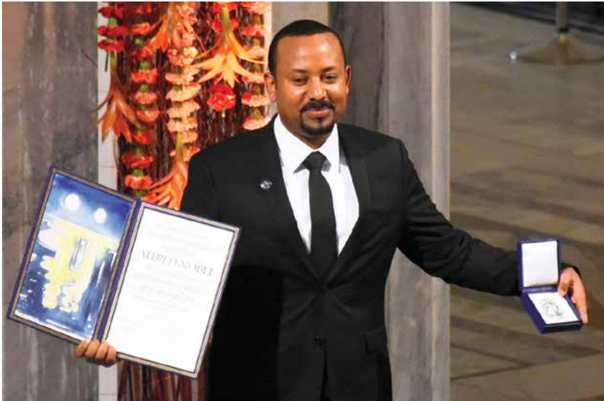
ראש ממשלת אתיופיה, אביי אחמד עלי, מקבל פרס נובל לשלום, אוקטובר 2019

מחקרים אלו מציגים, בראש ובראשונה, את יהודי אתיופיה כאתיופים פעילים ומעורבים בסביבתם, שמזדהים עם מכורתם אתיופיה, לאו דווקא במישורים דתיים, אלא דווקא במישורים אידיאולוגיים אחרים, שאינם מסתכמים ב"כמיהה לירושלים". המחקרים האלו מייצרים גם נרטיב היסטורי חלופי לקריאת ההיסטוריה של יהודי אתיופיה וקוראים תיגר על הפרספקטיבה המסורתית המוכרת לנו ממחקר ומתפיסות ביתא ישראל בישראל. כך, לאחרונה נשמע קולן של קהילות זיכרון יהודיות אתיופיות חדשות; דבר שאולי תורם לתפיסה חדשה שלהן בישראל, ואולי חשוב אף יותר לתמורות בתפיסתן העצמית כחלק מהמאבק בין קהילות הזיכרון וההנצחה הישראליות והאתיופיות גם יחד.