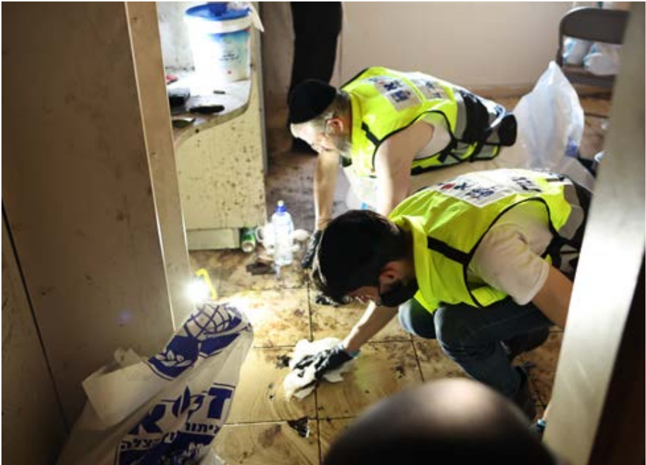
מתנדבי זק"א מנקים את זירות הטבח בקיבוץ חולית.

כדי לאפשר חשיבה משותפת, תיאומים, ושיתופי פעולה בידע ובמשאבים. בפורום חברים אנשי יד ושם, הספרייה הלאומית, הארכיון הציוני, איגוד הארכיונאים, יוצרים דוקומנטריים, חוקרים, היסטוריונים, אנשי תקשורת, משפטנים, אנשי טיפול, אנשי הפקה וצילום ועוד. העדויות ישמשו להסברה, למחקר, לתחקיר ולתיעוד היסטורי שיהיה לו בודאי ערך בעוד שנים רבות. גם אני חברה בפורום כנציגת האו"פ ובמסגרתו אני מציעה את שירותי הצילום וההפקה באולפנים שלנו, לטובת גופים שמעוניינים לצלם עדויות.