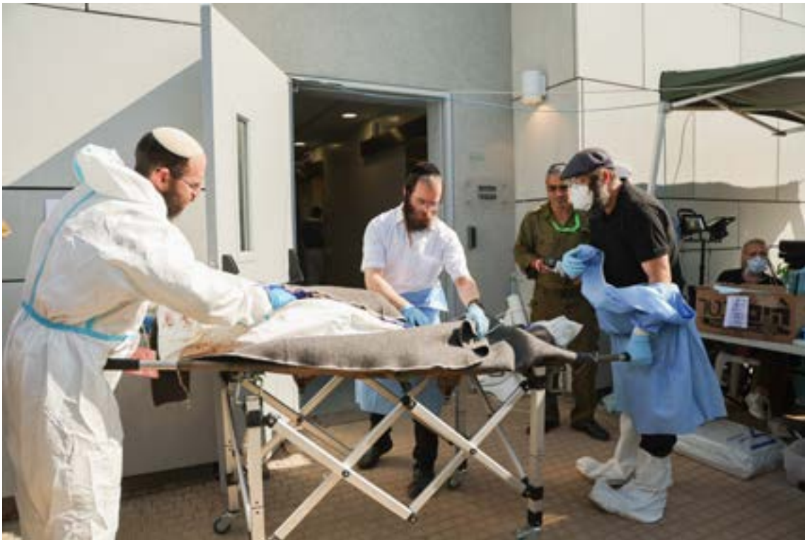
למעלה: מתנדבי זק"א מפנים גופות בקיבוץ בארי. למטה: מתנדבי זק"א בבסיס שורה לזיהוי גופות.