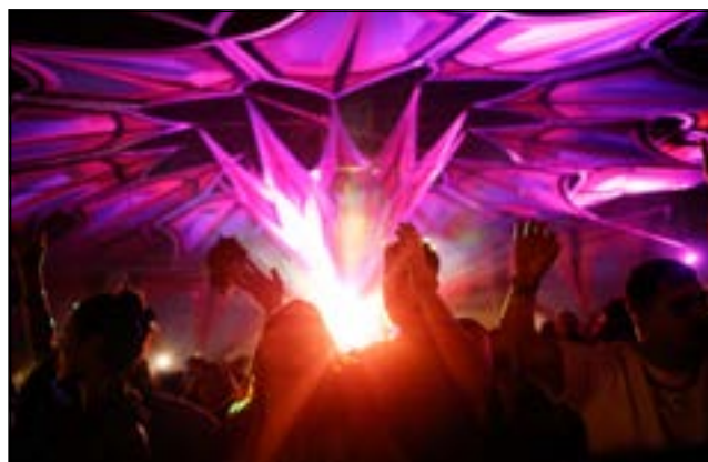
פסטיבל נובה, בקיבוץ רעים.

"גיא ואלון יצאו ראשונים לכביש הגישה, אלמוג שני ואנחנו שלישיים, כשבינינו היו כמה רכבים. פתאום שמענו צרור יריות בלתי פוסק שנשמע קרוב להפליא. ומישהו צעק: 'יורים על חברים שלי, יורים על חברים שלי'. לא ברור מה קורה, ושומעים יריות מכל כיוון, טילים שנופלים מקרוב ומרחוק, ועוד יירוטים מעל הראש.