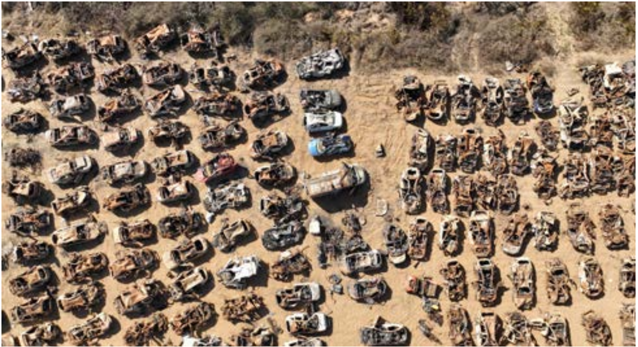
חניון תקומה.