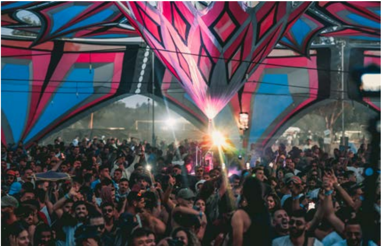
פסטיבל נובה, בקיבוץ רעים.

תמיר: "אז יצאנו החוצה והסתכלנו וראינו חור בין שתי מכוניות בשורה האחרונה, ואז אני אומר 'בואו ננסה לנסוע דרך שם', והגענו לכביש 232, 'כביש המוות'. בצומת אנחנו רואים ניידת משטרה ושטר שמכוון אותנו דרומה. ואנחנו לא מבינים. זה מחזה מוזר, שוטר שמכוון אותנו דרומה במצב כזה. "טוב, אז התחלנו לנסוע דרומה, וכל הדרך ממשיכים לשמוע טילים ולראות נפילות. ומתקשרים אלינו מהבית בלחץ, ואנחנו מרגיעים אותם שיצאנו והכול בסדר. שמנו קצת מוזיקה באוטו כדי להירגע. אבל ויז כל הזמן מורה לנו לנסוע צפונה, לא משנה מה - צריך לנסוע צפונה. אבל אנחנו ממשיכים דרומה לכיוון הגבול."