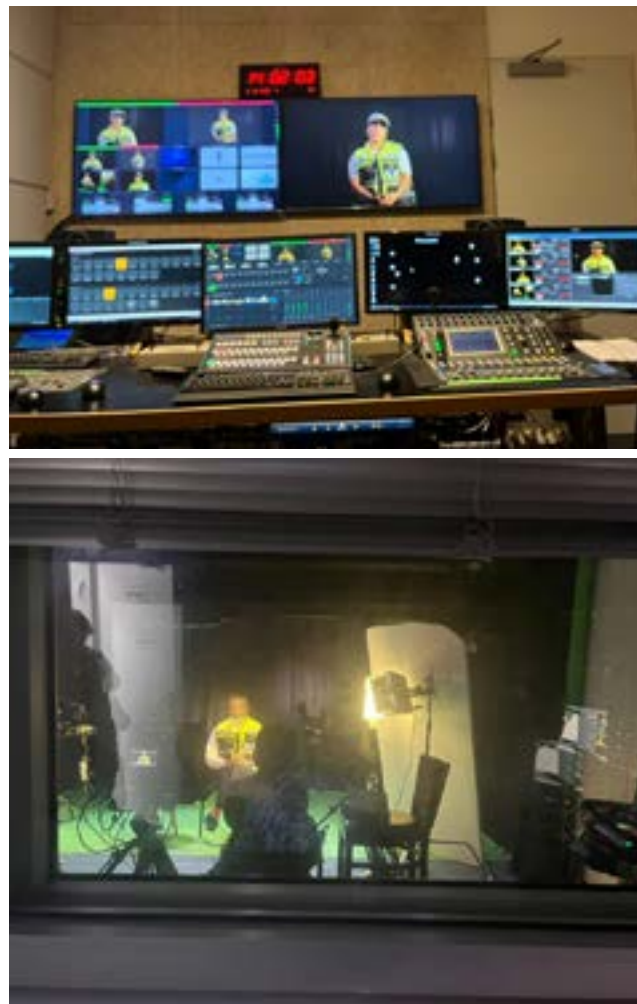
מתנדבי זק"א מתראיינים באולפני שה"ם באוניברסיטה הפתוחה

אלה הם חלק ממתנדבי זק"א שהגיעו להצטלם אצלנו באולפני האוניברסיטה הפתוחה ברעננה. קבוצה הטרוגנית של מתנדבים-מלאכים - דתיים, חילוניים, נשים, מוסלמים. כל אחד ואחת מהם מגיע מעולם אחר, מרקע שונה. כל אחד ואחת מסיבותיו הוא. מנהל בית ספר, דולה, מנופאי, מנהל יחסי ציבור, אינסטלטור, בלוגר של טיולים, עורך דין, טבח, איש סייבר ואבטחת מידע ועוד - כשהמכנה המשותף ביניהם הוא הרצון העז והבלתי ייאמן להקריב את נפשם ולתת מעצמם לטובת אחרים. להציל חיים ולקדם את המתים.