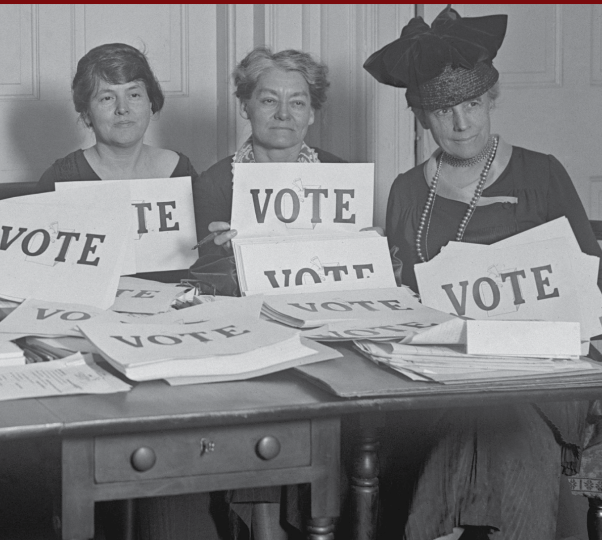
האם הבחירות לרשויות המקומיות יובילו לשיפור הקשר של הבב"ר עם התושבים?

זרם המדיניות, והזרם הפוליטי. שינויים בזרמים אלו מעודדים שינוי מדיניות. כך, שינוי בזרם הבעיות נוצר כאשר משבר חריף או שינוי ערכי משמעותי מחייב את המערכת להגיב; שינוי בזרם המדיניות נוצר כאשר הצטברות של מידע בקרב מומחים מאפשרת יצירת תוכניות מדיניות; ושינוי בזרם הפוליטי קורה כאשר נוצר שינוי בקרב שחקנים מאקרו-פוליטיים, כגון פוליטיקאים ובירוקרטים, או בהלך הרוח הציבורי. בדרך כלל מתקיימים ומתפתחים שלושת הזרמים בלא שהם תלויים זה בזה, עד שהם משתלבים לערוץ אחד בנקודת זמן קריטית, הנקראת "חלון הזדמנויות", לצורך שינוי המדיניות. החלון נפתח באופן אקראי, לעיתים לזמן קצר, ולכן על יזם המדיניות לפעול מהר וביעילות. אולם, היזם אינו יושב וממתין לפתיחת