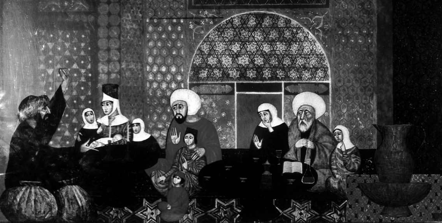
משפחה יהודית בסמינר (איזמיר) שבתורכיה חוגגת את השבת בחברת יהודי שנמלט מהפורגומים של חמלניצקי בפולין, שנת 1648/49

כאנשי משפחה לעתיד על-ידי הפיקוח שניתן בידיהם על המוסר המשפחתי, והן מן הבחינה המקצועית, כאנשי ציבור ודיינים לעתיד, על-ידי הסמכות שניתנה בידיהם לפסוק בענייני מנהג ומוסר ציבורי.