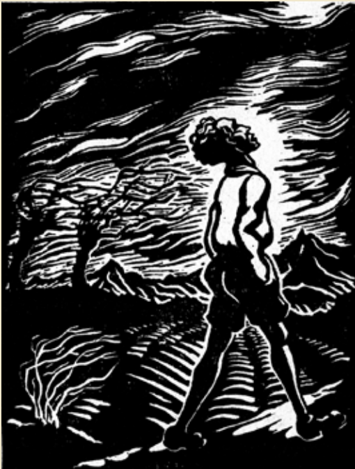
אורי כוכבא (ולטר קוך), בחיפושים בדד