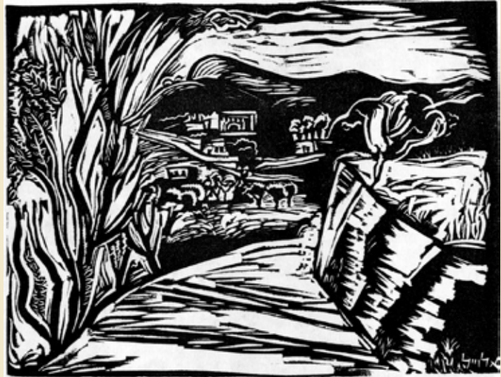
אריה אלואיל, הדרך למירון