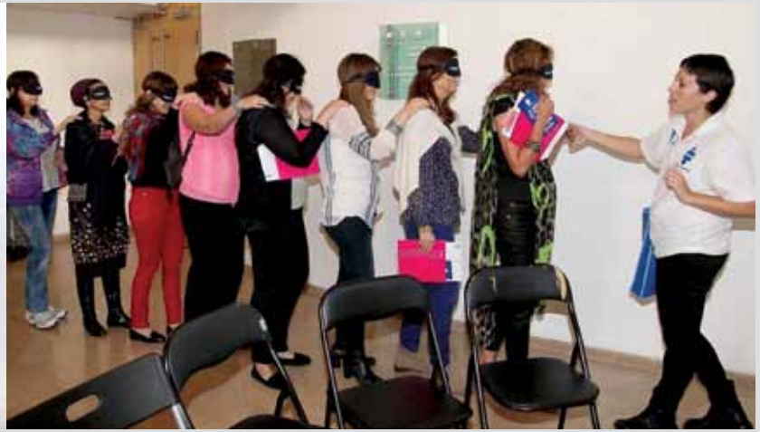
סדנת התנסות במוגבלויות

לאחרונה אושרו תקנות הנגישות החלות על המבנים ועל השירות. מהתקנות ייכנסו לתוקף באוקטובר 2015. האוניברסיטה הפתוחה מובילה את אתר המידע של מיזם "מהפכה בהשכלה" שעל פיו פועלים 13 מוסדות אקדמיים ובשנה הבאה יצטרפו מוסדות נוספים.