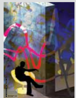
עיצוב נאור שיקמון בר עמי

לוחות חכמים, עטים חכמים, הגדת טקסטים על מסך מחשב, ריהוט מעוצב במיוחד בכיתות מצוידות - אלה רק חלק מהאביזרים המאפיינים את הכיתות במתקני האוניברסיטה שבהן מוצעים פתרונות לסטודנטים עם מוגבלות.