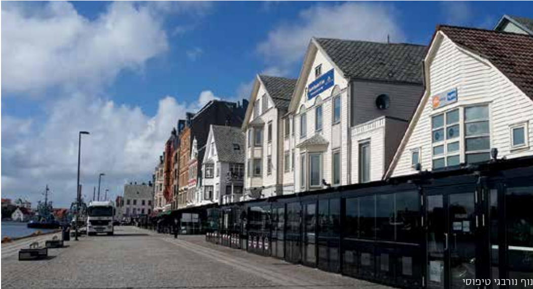
נוף נורבני טיפוסי