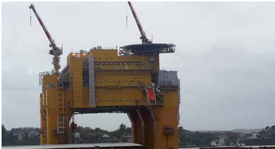
מתקן ענק בנמל הנפט והגז בעיר האוגזונד במערב נורבגיה

82% מהגברים הנורבגים מועסקים, מתוכם רק 10% במחצית משרה. מעל 77% מהנשים עובדות. פערי השכר הולכים ומצטמצמים. מעל 70% מעובדי המגזר הציבורי הן נשים. בדירקטוריונים 40% הן נשים