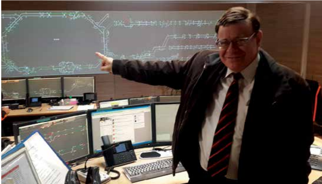
כותב המאמר במרכז הלוגיסטי של התחבורה בעיר אוסלו.

העורך הפיננסי של היומון הכלכלי, דאגנס נארינגסליו (Dagens Naeringsliv).