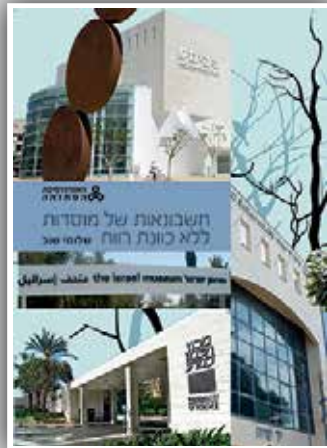
חשבונאות של מוסדות