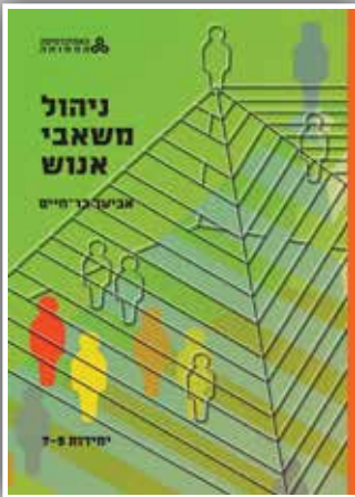
ניהול משאבי אנוש