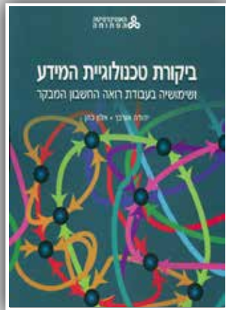
ביקורת טכנולוגיית המידע