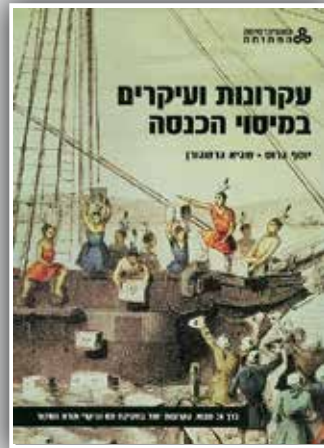
עקרונות ועיקרים במיסוי הכנסה