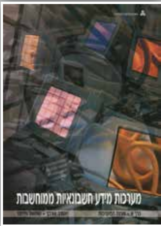
מערכות מידע חשבונאיות ממוחשבות