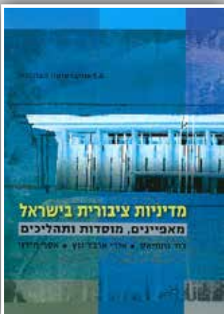
מדיניות ציבורית בישראל