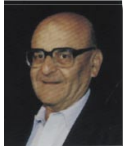
פרופ' גינזבורג: הנשיא השני של האו"פ

בסתיו 1976 פתחה האוניברסיטה הפתוחה את שעריה בפני ציבור הלומדים. 30 שנה לאחר מכן, כדאי לחזור אל ה"אני מאמין" של מקימי האוניברסיטה הפתוחה. קטעים מדברים שנשא ב־21.6.77 פרופ' אברהם גינזבורג, שכיהן כנשיא האוניברסיטה הפתוחה בשנים 1977–1987, בבית הנשיא בירושלים