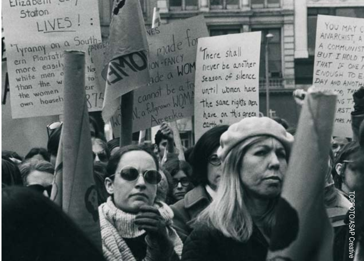
TOP: OT/OASAP Creative