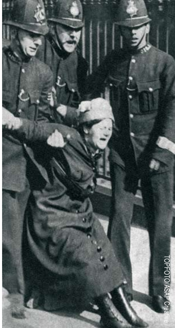
סופרג'יסטית בריטית בהפגנה ב־1910. כשפרצה מלחמת העולם הראשונה, הסופרג'יסטיות תמכו בה בהתלהבות

נשים התארגנו למאבק פוליטי – הן במאבק למען זכויות הנשים והן בקריאה להביא קץ למלחמות – אחרי עידן המהפכות, בסוף המאה ה-18. הופעתן בזירה הפוליטית והאזרחית קשורה לכינון המדינה המודרנית, שאחד התוצרים שלה היה האזרחות המודרנית. או אז התברר שזכות הבחירה אינה זכות אוניברסלית. היא הוגבלה בשלב ראשון לגברים בני המעמדות בעלי הרכוש, ובשלב שני – לגברים ללא קשר לרכושם. בכל מקרה, הנשים הודרו מאזרחות מלאה במדינה המודרנית החדשה. אחד הנימוקים המרכזיים להדרתן היה שהנשים אינן לוקחות חלק בשירות הצבאי ולכן הן אינן זכאיות לשוויון פוליטי מלא.