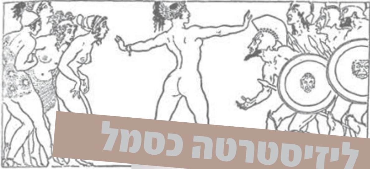
Illustration by Norman Lindsay