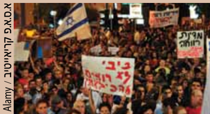
מחאת קיץ 2011: חלון הזדמנויות שנוצל

בתחום המחאה החברתית קיים אלמנט של "הדבקה", כמו באופנה, ובמהלך ההיסטוריה קרה לא פעם שכאשר במקום מסוים התפתחה תנועת מחאה – גם אם זה היה סביב נושא ספציפי – כדור השלג החל באותו רגע להתגלגל ומחאה פרצה גם במקום אחר, אף שהסיבות והנסיבות היו שונות לחלוטין. לא פעם משווים את המחאה ללווייתן שצץ ועולה לפתע אל פני המים ואחרי זמן מסוים נעלם, כדי להופיע שוב – שוב במפתיע – בהמשך. אחת המשתתפות בסדנה העלתה את האפשרות שמה שאנחנו רואים איננו לווייתן אחד, שעולה ויורד ושוב עולה, אלא להקה של דגים מסוגים ובגדלים שונים. שהרי ברור שהמחאה החברתית של קיץ 2011 בשדרות רוטשילד אינה דומה למחאה של כיכר תחריר וזו אין לה כמעט דבר במשותף עם אנשי המחאה בניו יורק. מה שיש בכל זאת הוא תהליך תרבותי, תודעתי חוצה גבולות שאומר "זה זמן מחאה". הנה כמה ציטוטים מתוך הדיונים שהתפתחו במושב הסדנה (ותודה ליובל לבל על הדיווח): "האנטי-פוליטיקה של המחאה הזו היא מעניינת: לא 'השינוי מתחיל מבפנים', הכתובת היא המדינה הנאו-ליברלית." "אפשר להסתכל על המקרה הישראלי כבר השוואה למקומות אחרים בעולם, גם אם הוא מקרה ייחודי." "המחאה נתנה קול לציבורים שלא היה להם קול עד לאותו הרגע." "היה חלון הזדמנויות של חודשיים, והוא נוצל עד תום, אך הדור הזה לא הולך הביתה... הם רוצים לשנות את החברה".