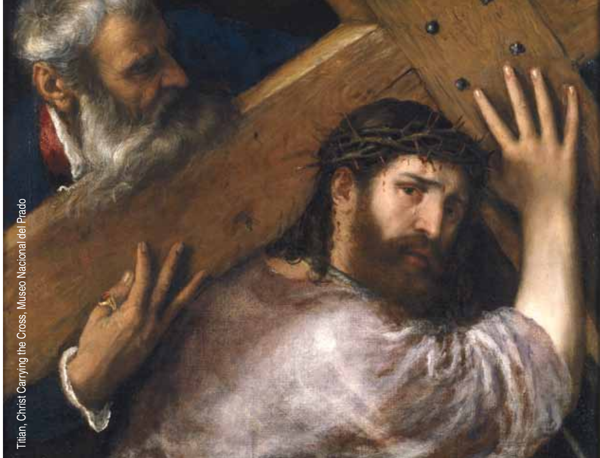
Titian, Christ Carrying the Cross, Museo Nacional del Prado

ישו – "סוכן כפול" בשירות היהדות: הנצרות היא פרי קונספירציה יהודית. בתמונה: "ישו נושא את הצלב" – ציור מאת טיציאן