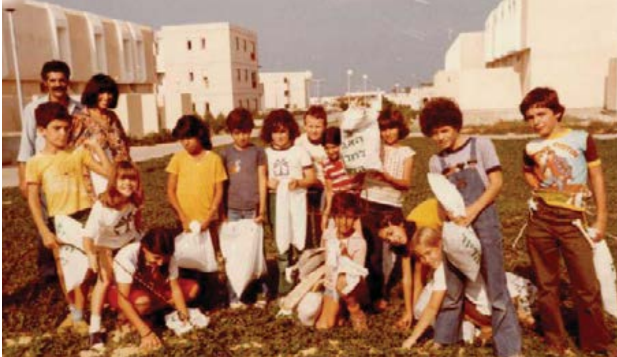
זיכרון חי שהותיר חותם בחייהם. ילדי ימית המפונים

עמית מספרת כי לעומת בית הספר שבו דובר מעט על נושא הפינוי, בבית ובמסגרת המשפחתית לא דיברו כלל על העתיד להתרחש: