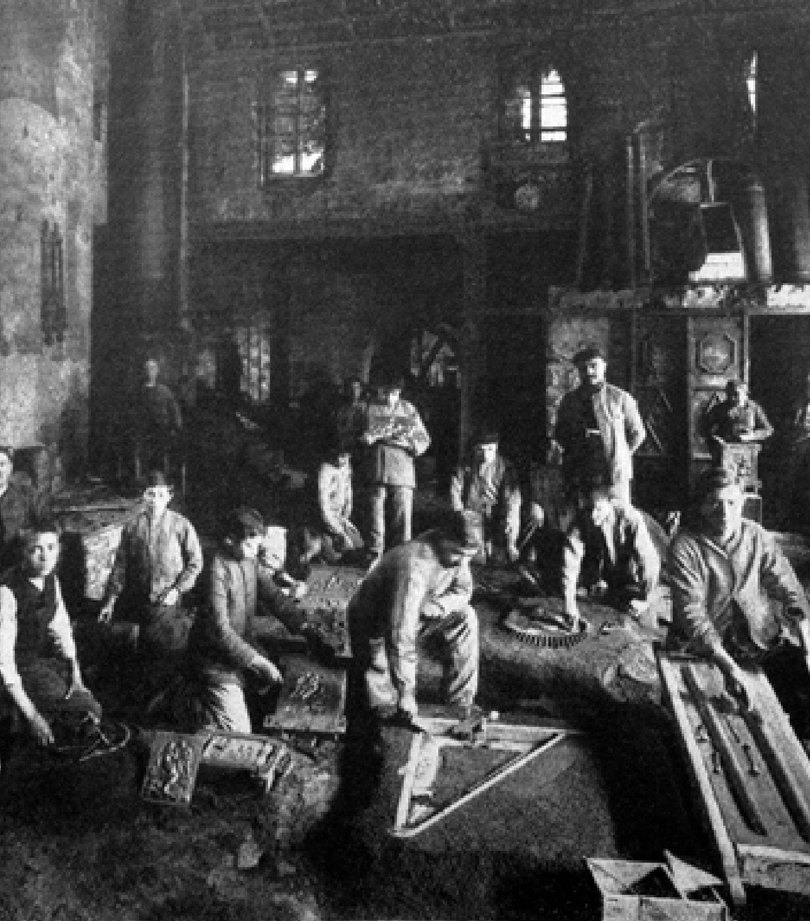
המחלקה ליציקת תבליטים ואבזרים שמושיים, "תורה ומלאכה", ירושלים, שנת 1905 בקירוב