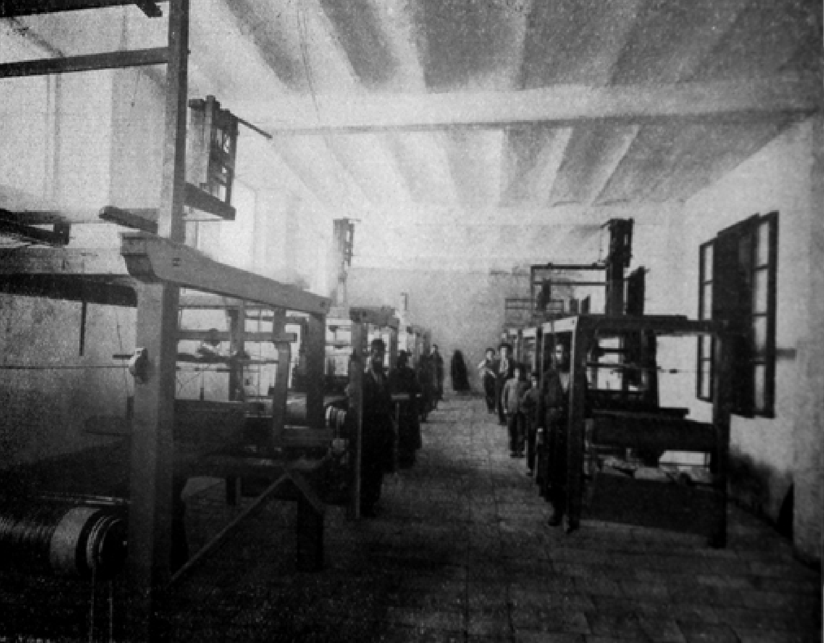
המחלקה לטווייה, "תורה ומלאכה", ירושלים, שנת 1905 בקירוב

מגולפות על פי דגמי רהיטים איטלקיים-פלורנטיניים שהובאו מחוץ-לארץ. מקצת הרהיטים ניתנו כמתנה לראשי השלטון העות'מני בירושלים, ואחרים נרכשו בידי העשירים והמשכילים מקרב הקהילה הספרדית, שבדרך זו תמכו בבית-הספר. בכמה מבתיהם של ותיקי הספרדים בעיר עוד אפשר למצוא פריטים של רהיטי "אליאנס" אלה. (רבקה גונן ודוד קרוינקר, לגור בירושלים , מוזיאון ישראל, ירושלים 1993, עמ' 108)