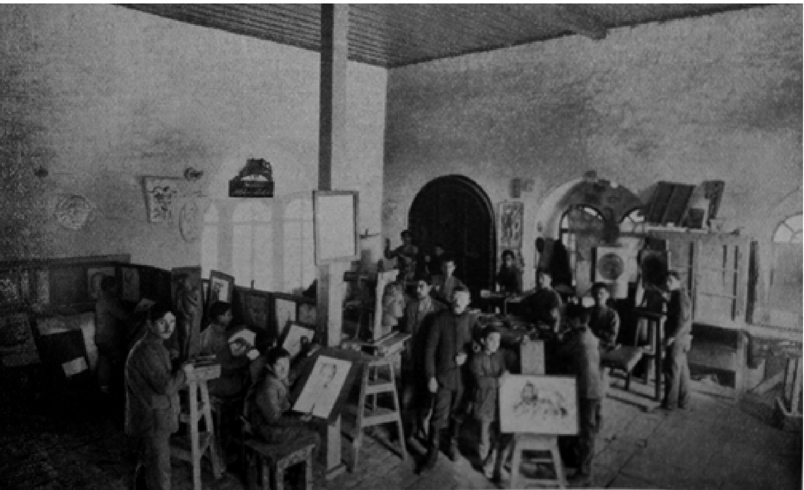
המחלקה לציור, "תורה ומלאכה", ירושלים, שנת 1905 בקירוב