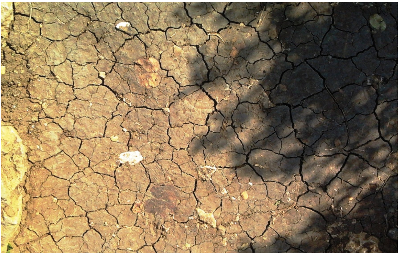
איור 2 < קרקע סדוקה בעיצומו של חורף ליד הבניאס. בדצמבר 2011, שהיה יבש במיוחד